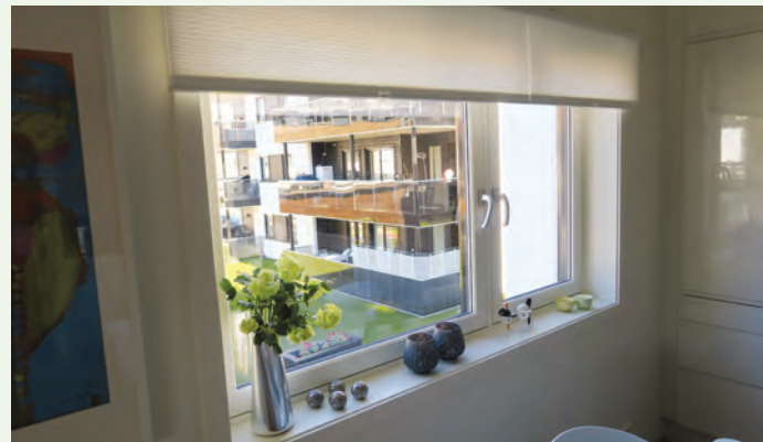
Utsikt fra kjøkkenet mot fellesområdet.

forbindelse med parkeringskjelleren, samt at vinteren med snø og kulde også bidro til ekstraarbeider.