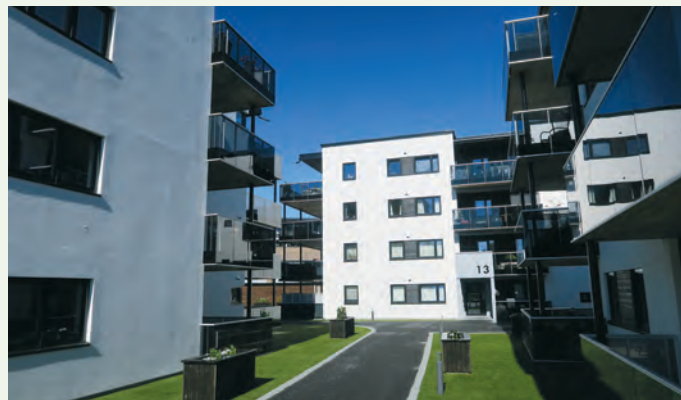
Man får et godt inntrykk med det samme man kommer inn på fellesområdet mellom blokkene.