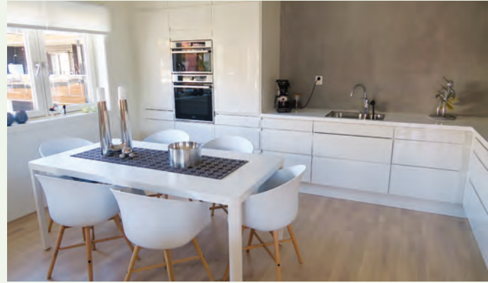
God planløsning, godt med utelys og åpen kjøkkenløsning.