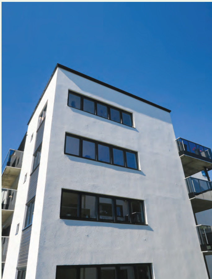
Hvite fasader gjør det lyst og trivelig.