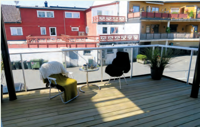
Lun terrasse på bakkeplan.