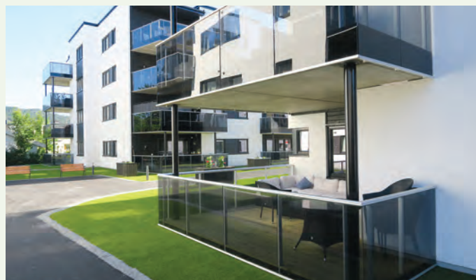
Leilighetene har store balkonger.